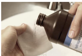
..... het ontsmettingsmiddel .....