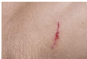
..... de snijwonde .....

de pleister – de snijwonde – het steriel gaas – het verband – de schaafwonde – het ontsmettingsmiddel