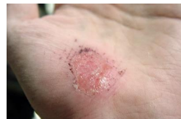
..... de schaafwonde .....