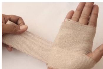
..... het verband .....