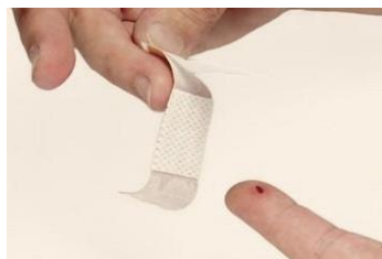
..... de pleister .....