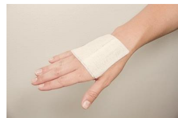
..... het steriel gaas .....